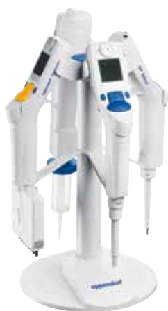
Xplorer用充電スタンド4本架