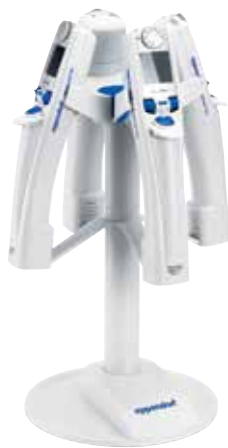
マルチピペットチャージャーシェルで 電動のMultipetteシリーズに対応

Eppendorf Xplorer / Xplorer plus, Multipette E3 / E3xに対応した充電スタンドです。充電したままスタンドに架けておけるため、充電された状態ですぐに使い始めることができます。