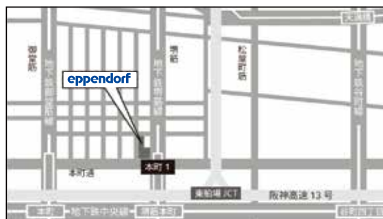
大阪会場 周辺地図

地下鉄堺筋線・中央線「堺筋本町駅」17番出口すぐ、地下鉄御堂筋線「本町駅」7番, 3番出口徒歩7分。14階にお越しください。