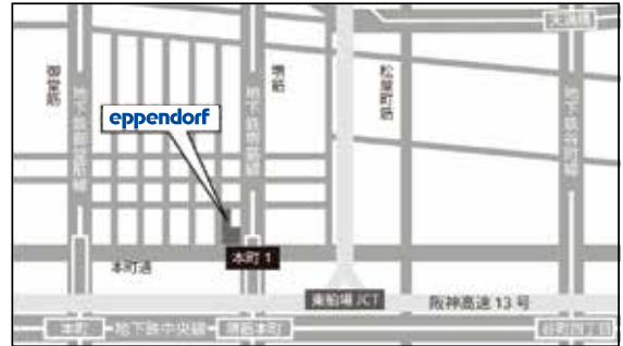
大阪会場 周辺地図

マイクロピペットの正しい使い方セミナーは福岡でも開催しています。詳しくはお問い合わせください。