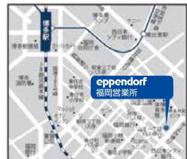
福岡会場 周辺地図

福岡市営地下鉄空港線「東比恵」駅1番出口より徒歩15分 西鉄バス「山王一丁目」停留所より徒歩3分