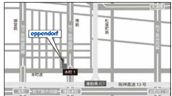
大阪会場 周辺地図

地下鉄堺筋線・中央線「堺筋本町駅」17番出口すぐ、地下鉄御堂筋線「本町駅」7番, 3番出口徒歩7分。14階にお越しください。