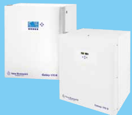
Galaxy 170 R (左) と 170 S (右)