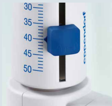
Neu! Ergonomisch geformter Schieber für die Volumeneinstellung und Fixierung