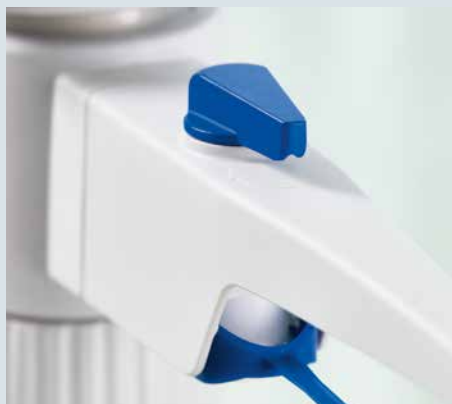
Neu! Optimierter Rückdosierventilhebel für die einfache Umstellung zwischen Rückdosierung und Abgabeposition