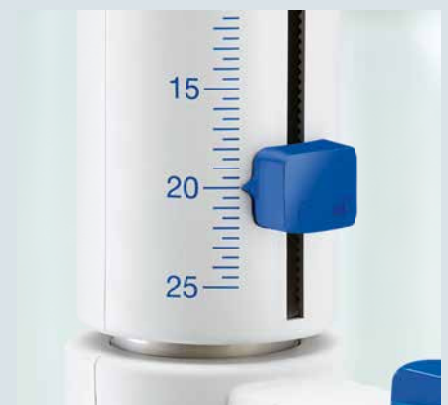
Neu! Verbesserte Volumenskala für bessere Lesbarkeit und präzise Volumeneinstellung